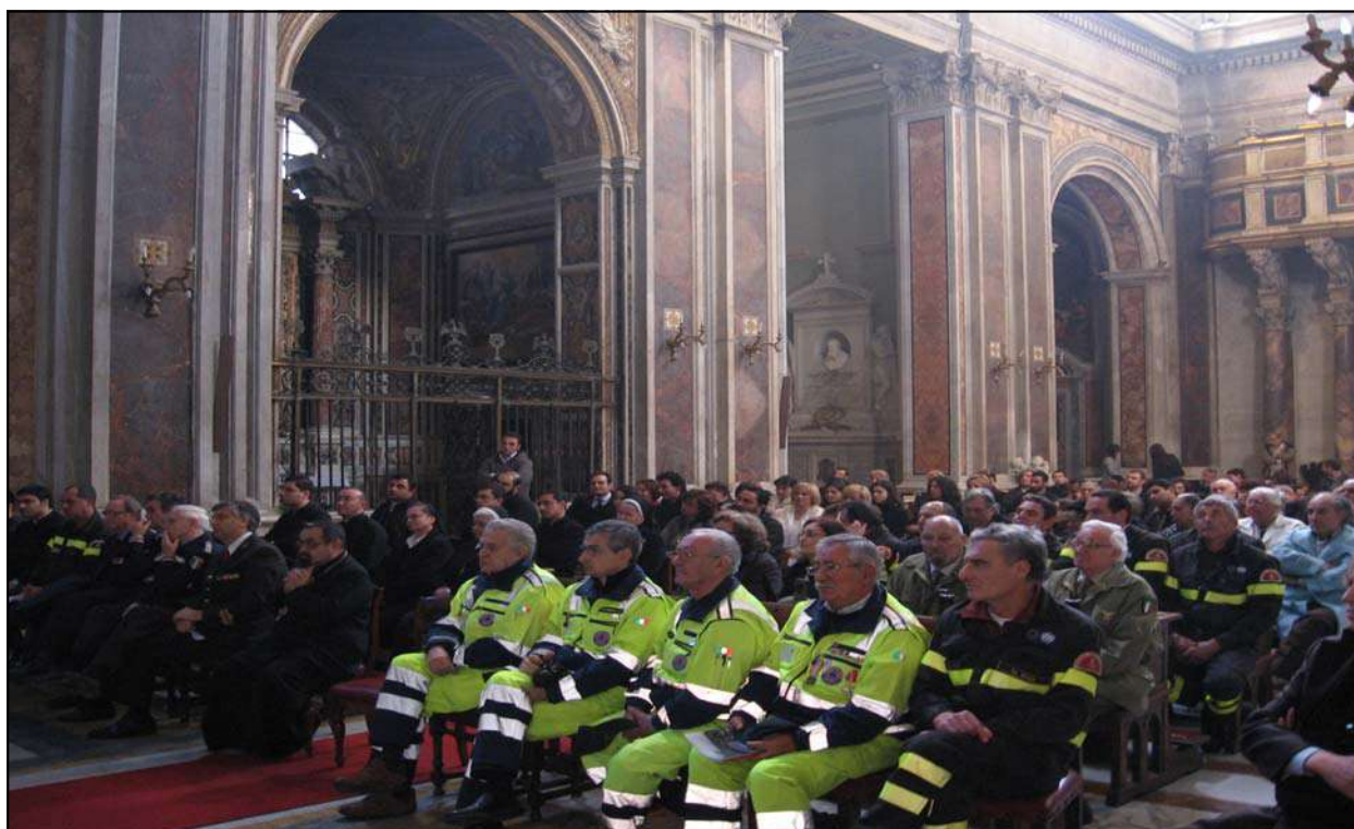
Commosa partecipazione della comunità e delle istituzioni