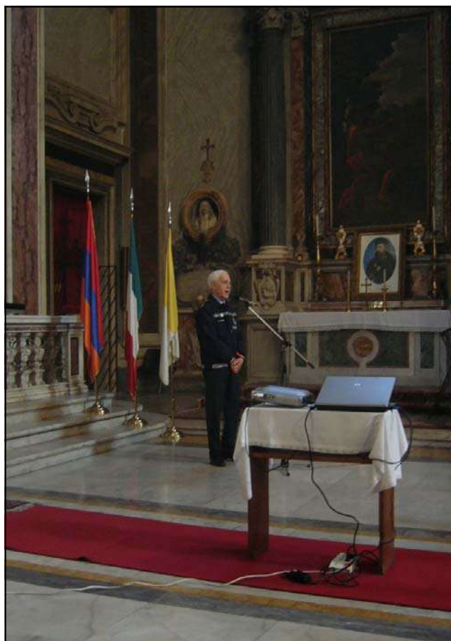
L'Ammiraglio Giovanni Vitaloni in rappresentanza della Protezione Civile Nazionale Italiana

Dipartimento Protezione Civile Comune di Roma Vigili del Fuoco Protezione Civile Volontaria-Bergamo Associazione Nazionale Alpini Istituto di cooperazione Universitaria