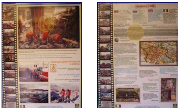
Due tabelloni della Mostra allestita

Istituzioni e Organizzazioni italiani presenti: