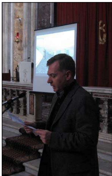
Dott. Dikran Samuelian (Ambasciata Armenia)

7 D I C E M B R E 1 9 9 8 . 7 D I C E M B R E 2 0 0 8