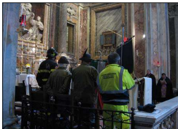
I Gonfaloni dell'A.N.A, della Protezione Civile Volontaria-Bergamo e dei Vgili del fuoco partecipano alla Processione.