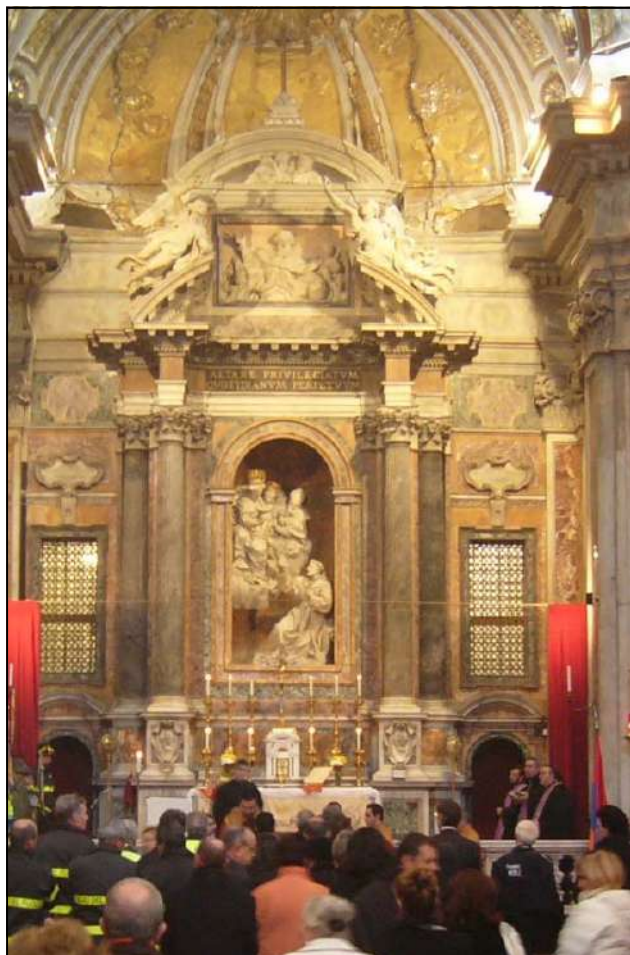
Chiesa Armena di San Nicola da Tolentino

7 D I C E M B R E 1 9 9 8 . 7 D I C E M B R E 2 0 0 8