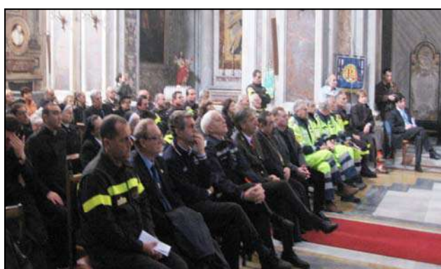
Rappresentanza delle autorità italiane